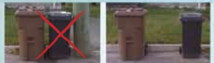
Mauvaise manière Bonne manière