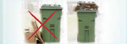
Mauvaise manière Bonne manière